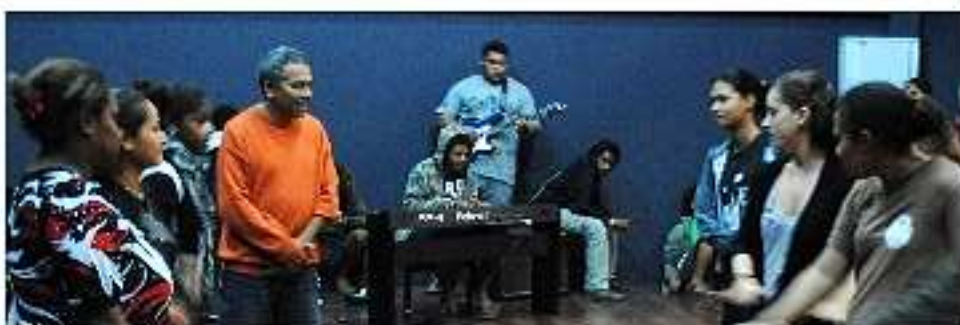
Répetition des danseurs et musiciens lundi 4 juillet dans l'auditorium de l'école de musique de Koné.